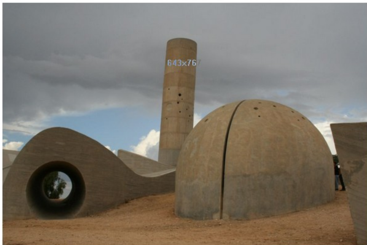
אנדרטת חטיבת הנגב. טהרנים יטענו שאינה מבנה ברוטליסטי טהור, אבל מותר להתעלם

חשיבה תיירותית, כלומר איך למשוך אנשים לבקר בעיר, לבלות בה לילה, לאכול במסעדות ולשבת בבתי הקפה, היא לא בדיוק התחום שבאר שבע הצטיינה בו עד עכשיו. ספק גדול אם צעד כאימוץ התואר "בירת הברוטליזם", סגנון אדריכלי לא קל לעיכול, ימשוך לעיר מיליוני תיירים בעלי חזון. אחרי הכל, בלוק רבע הקילומטר הוא בניין שמשאיר את הצופה בו פעור פה, אבל הוא לא ארמון האלהמברה בגרנדה. עם זאת, הסיור בעקבות מבני הברוטליזם , שקל ופשוט לעשותו לבד, אם כי מוטב לעשותו בהדרכה, הוא חידוש מרענן בשמי התיירות בעיר. זאת דרך חדשה, שונה ומסקרנת להכיר את העיר שלא קל לאהוב.